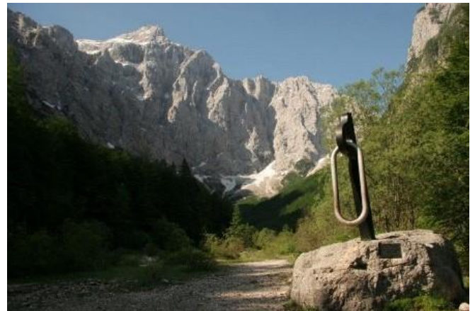
Triglav s razdvajanja Tominškoveg pota i pota čez Prag u dolini (Spomenik partizanskom planinaru)

Harmica-Ljubljana-Mojstrana-Dolina Vrata (Aljažev Dom)